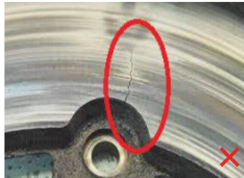
La superficie de la pieza está agrietada