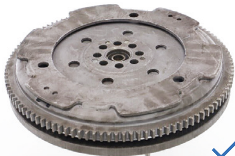
La pieza completa sin partes faltantes y dañadas