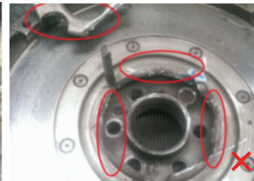
Daños tras el desmontaje