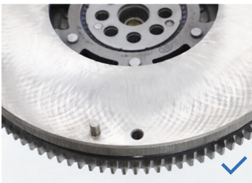
La superficie de fricción está sin daño