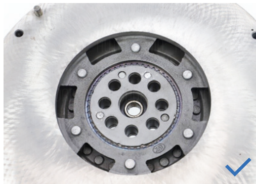
Asas sin daños tras el desmontaje